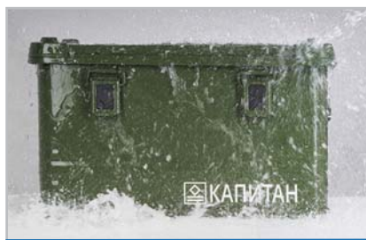
IP65 – защита от брызг со всех сторон (брандспойт)