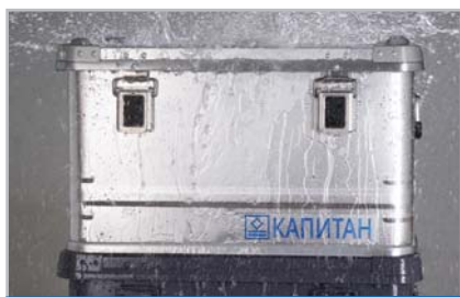
IP54 – защита от брызг сверху (Стандартное исполнение)