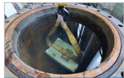
IP67 – защита от попадания воды при погружении на 1 м